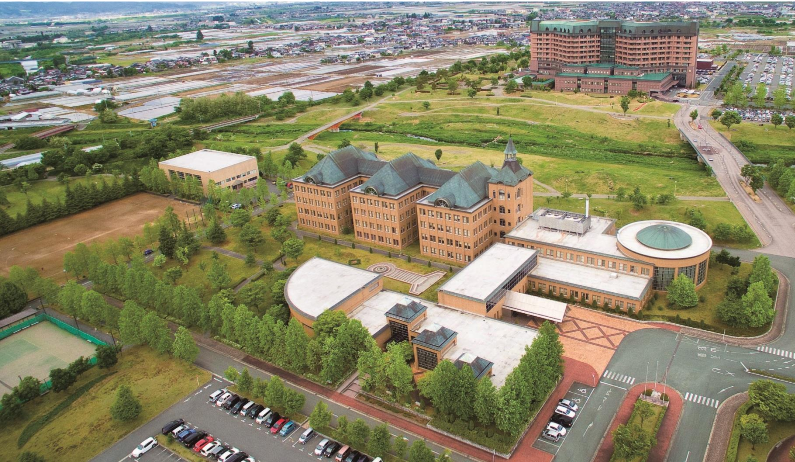
写真：山形県立保健医療大学全景